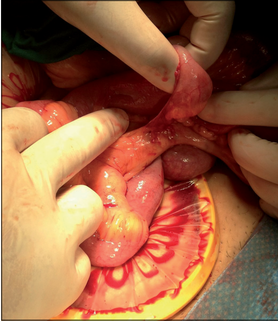
Figura 2. Hernia interna.