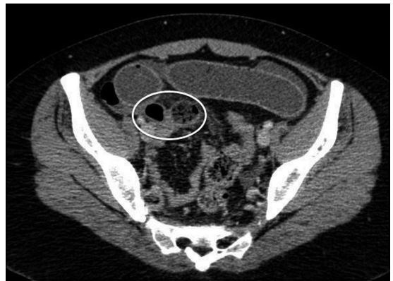
Figura 1. TC que muestra la obstrucción intestinal.

Se realizó laparotomía exploradora apreciando a nivel de íleon medio a 60 cm de la válvula ileocecal un divertículo de Meckel (DM), inflamado en su tercio medio y distal, íntimamente adherido al mesenterio ileal, el cual condiciona hernia interna a través de la que se introduce segmento de íleon proximal, el que está atascado (Figuras 2 y 3). Se desobstruye intestino apreciando en la base del divertículo una estenosis significativa (Figura 4), motivo por el cual se decide resección intestinal y anastomosis latero-lateral. La evolución postoperatoria no presentó incidentes. La biopsia de la pieza quirúrgica concluyó DM con signos de inflamación difusa, no apreciando tejido ectópico