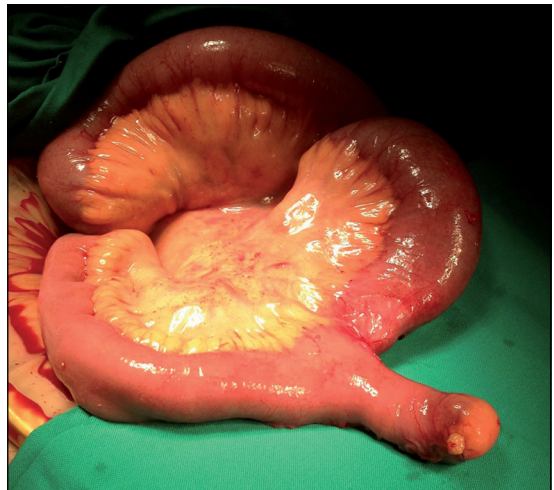
Figura 4. Divertículo con estenosis en la base.