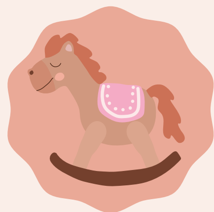
Foto yo ak foto yo se yon bon fason pou rive konnen nouvo bagay epi aprann nouvo mo.

nonmen tout bagay se yon bon fason pou ou rive konnen nouvo mo, se objè, jwèt, pati nan kò; Ou kapab tou imite son bèt.